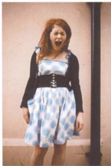
1. Gritando el Silencio 'Untitled'. 60 x 84 cm. Digital Prints. 2005 2. Gritando el Silencio 'Untitled'. 84 x 60cm. Digital Prints. 2005

Ione Saizar was born in the Basque Country. She received a BA in Photography from the London College of Printing, with a scholarship from the Cultural Institution Koldo Mitxelena. She then completed an MA in Image and Communication at Goldsmiths College. She has worked with publications such as El País , El Mundo , Elle , Vogue , Vanidad , AlterEgo , NME , Eseté and The Face , and has exhibited her photographic work at galleries in Spain, Great Britain and Germany. This body of work ranges from the documentary portrayal of Japanese culture to a study of the pose of calendar girls in masculine scenarios ( 'Garage Glamour Bodies of Desire, Oxo Tower London ). Due to the approach she proposes in each of her pictures, Ione Saizar is now considered one of the most intuitive contemporary photographers in the field.